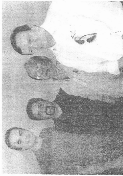
QUATRO NOMES Um grupo de bons nomes. Quem são eles?